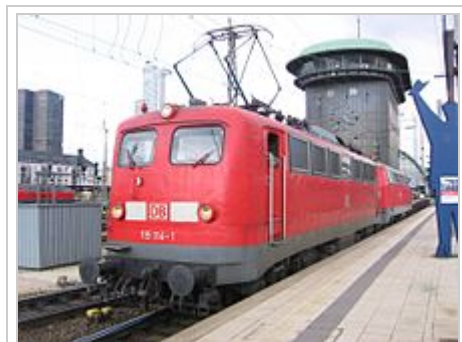
115 114 (ehem. 110.1) im Hauptbahnhof Frankfurt/Main