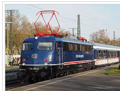
110 469 in Lackierung der National Express Rail GmbH, jetziger Eigentümer ist seit April 2016 TRI Train Rental GmbH