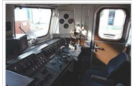
Führerstand der 110 243

An Sicherheitseinrichtungen auf dem Führerstand sind die mechanische oder elektronische Sicherheitsfahrerschaltung, Punktförmige Zugbeeinflussung (inzwischen entsprechend den neuen Vorschriften mit Softwarestand der PZB 90) und Zugfunk-Geräte vorhanden (mit GSM-R-Funk ausgestattet). Neu sind noch die Computer für den elektronischen Buchfahrplan EBUa und die bei