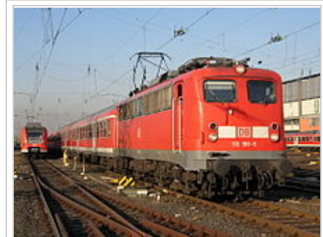
110 166 in Frankfurt Hbf