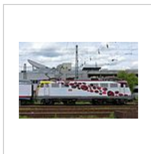
110 329 zieht den Science Express