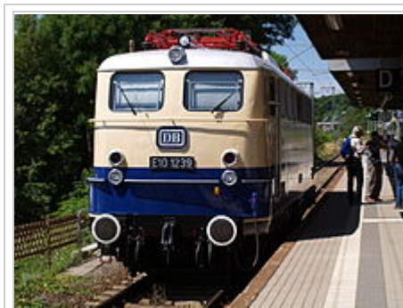
in den Ablieferzustand zurückversetzte Museumslokomotive E 10 1239