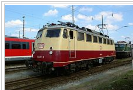
113 311-5 im DB Museum Koblenz

Bei der Baureihe 114 handelte es sich um die zwanzig umgezeichneten Fahrzeuge der dritten Serie der Baureihe 112, die auf Serien-Drehgestellen der Baureihe 110 bis zu 160 km/h laufen durften. Wegen starken Verschleißes musste die Höchstgeschwindigkeit der 112 485 bis 504 ab 1985 auf 140 km/h begrenzt werden. Zur Unterscheidung von den anderen Lokomotiven der Baureihe 112, die noch 160 km/h fahren durften, wurden sie ab 1988 als Baureihe 114 bezeichnet (die Baureihennummer 113 wurde ausgelassen, da zu diesem Zeitpunkt noch die in S-Bahn-Farben lackierten Exemplare der Baureihe 111 buchhalterisch als Baureihe 113 geführt wurden).