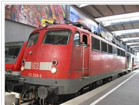
113 309-9 von DB AutoZug 2009 in München Hbf