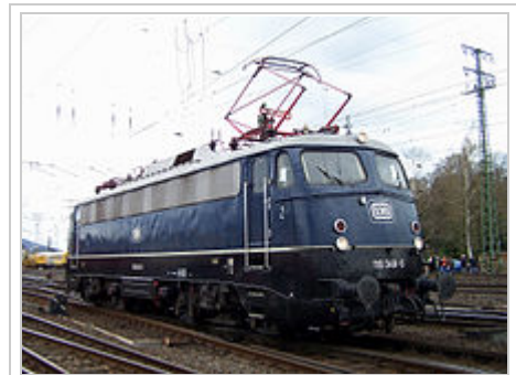
110 348 bei einer Fahrzeugparade des DB Museums in Koblenz-Lützel, einer Zweigstelle des Verkehrsmuseums in Nürnberg