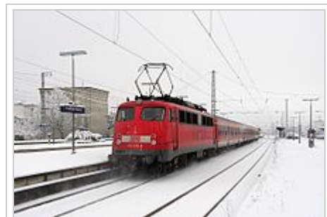
Verkehrsrote 110.3 schiebt einen Regionalzug