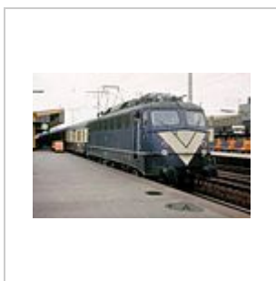
DB-Baureihe 110 im Versuchswarnanstrich 1980 in Essen

2009 wurden die Lokomotiven 110 325-8 und 110 329-0 für die Wanderausstellung Science Express im Design der Ausstellung präpariert. Von April bis November 2009 bereiste dieser Zug mehr als 60 Städte in Deutschland. Die 110 325-8 wurde im April 2010 verschrottet, die 110 329-0 Mitte Januar 2011 und die 110 487-6 im Dezember 2012.