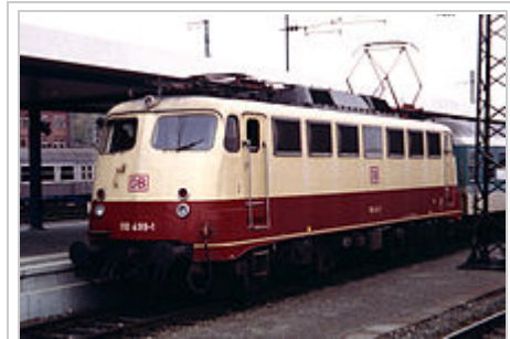
110 499-1, ehem. 114 499-7 im Hauptbahnhof Würzburg (28. Oktober 1995)

115 114 schied im September 2013 aus dem aktiven Bestand aus und wurde „z“-gestellt. Am 20. Oktober 2013 wurde sie wieder reaktiviert und bekam eine Verlängerung für ein Jahr. Sie hat ihre HU in Dessau zum 28. Januar 2014