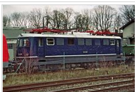
Vorserienlokomotive E 10 005 im Jahr 2007

beschloss der zuständige Fachausschuss der Bundesbahn die Beschaffung zweier Grundtypen von Elektrolokomotiven mit weitgehend standardisierten Bauteilen. Dies sollten eine sechsachsige Güterzuglokomotive ähnlich der Baureihe E 94 und eine vierachsige, an die Baureihe E 44 sowie die schweizerische BLS Ae 4/4 angelehnte Universallokomotive sein.