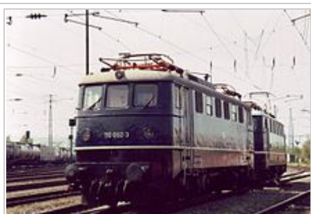
Vorserienlokomotive E 10 002 im Jahr 2006