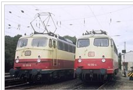
Baureihe 112 in Hamburg (1984)