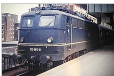
110.1 in kobaltblauer Farbgebung und Einzelleuchten

Die ersten Serienlokomotiven der Baureihe E 10 erhielten Ordnungsnummern ab 101 aufwärts und werden entsprechend auch als Baureihe E 10.1 bezeichnet. Im Gegensatz zur E 40 war die E 10 mit einer elektrischen Widerstandsbremse ausgerüstet worden. Daher unterscheiden sich beide Baureihen minimal im Dachbereich. Ab Dezember 1956 wurden in mehreren Serien insgesamt 379 Fahrzeuge von den Herstellern Krauss-Maffei, Krupp, Henschel (alle mechanischer Teil) sowie SSW (Siemens-Schuckertwerke), AEG und BBC (elektrischer Teil) ausgeliefert. Die Serienmaschinen lassen sich in drei optisch unterschiedliche Ausführungen unterteilen: