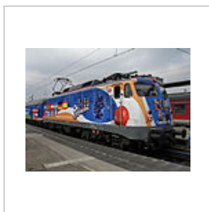
110 321 mit KI.KA-Beklebung