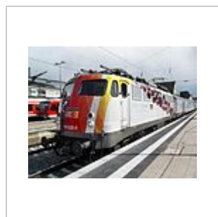
110 325 vor dem Science Express des BMBF