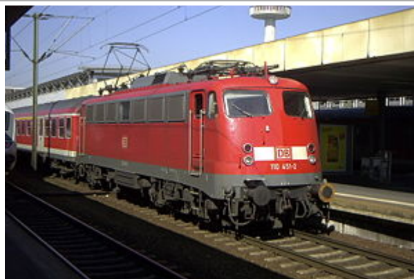
110 451 in Hannover Hbf