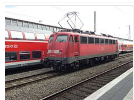
115 448-3 der DB Fernverkehr (ehemalige BR 113) im August 2015 in Münster (Westfalen) Hauptbahnhof