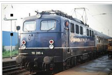
110.2 in kobaltblauer Farbgebung und Doppelleuchten

Die ersten Serienlokomotiven der Baureihe E 10 erhielten Ordnungsnummern ab 101 aufwärts und werden entsprechend auch als Baureihe E 10.1 bezeichnet. Im Gegensatz zur E 40 war die E 10 mit einer elektrischen Widerstandsbremse ausgerüstet worden. Daher unterscheiden sich beide Baureihen minimal im Dachbereich. Ab Dezember 1956 wurden in mehreren Serien insgesamt 379 Fahrzeuge von den Herstellern Krauss-Maffei, Krupp, Henschel (alle mechanischer Teil) sowie SSW (Siemens-Schuckertwerke), AEG und BBC (elektrischer Teil) ausgeliefert. Die Serienmaschinen lassen sich in drei optisch unterschiedliche Ausführungen unterteilen: