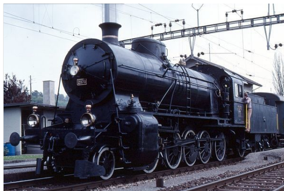
SBB C 5/6 in Thalheim-Altikon, 1983

Die bei Stiftung Historisches Erbe der SBB (SBB Historic) erhalten gebliebene 2978 wurde 1917 gebaut und war somit die letzte in Betrieb genommene Dampflokomotive der SBB. Mit der Ankunft des letzten offiziellen