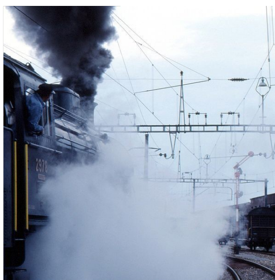
SBB C 5/6 in Thalheim-Altikon, 1983

Dampfzugs in Winterthur am 30. November 1968, welcher auch von einer C 5/6 gezogen wurde (die 2969), war die Dampfzeitära bei den SBB offiziell zu Ende.